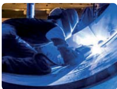
Soldadura TIG de aço inoxidável