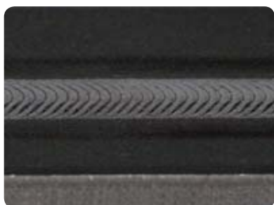
Soldadura Plasma de titânio