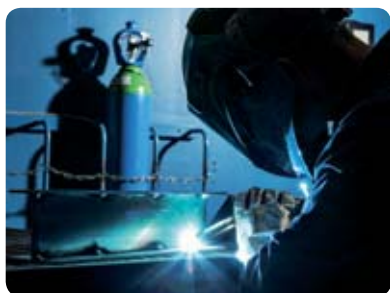
Soldadura MIG de alumínio

A solução de gás de proteção de alto desempenho para soldadura TIG e MIG de todos os materiais